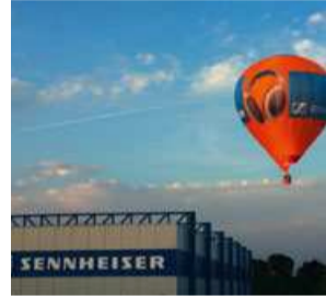
Sennheiser electronic, Wedemark

und sorgen für eine sichere Zukunft. Die Nord/LB und die Sparkasse Hannover zählen zu den führenden Kreditinstituten in Norddeutschland. Im Medienbereich sind unter anderem die Verlagsgesellschaft Madsack, die Schlütersche Verlagsgesellschaft und der Fernsehproduzent TVN überregional wichtige Akteure. Aus Hannover senden neben ARD und ZDF auch mehrere private Hörfunk- und Fernsehanstalten.