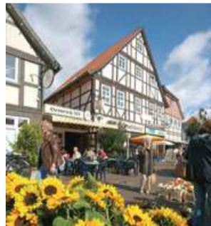
Einkaufsstraße Springe Shopping street in Springe Foto Photo 4