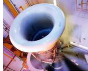
Testzelle MTU Maintenance Test cell at MTU Maintenance