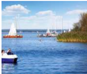
Steinhuder Meer, Region Hannover Lake Steinhude, Hannover Region

Sailing on Lake Steinhude, biking through the Deister Hills, researching the royal house of Guelph at Marienburg Castle: everyone will find an excursion to their taste in the Hannover Region. To the north-west of