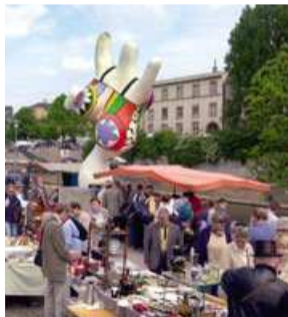
Flohmarkt · Flea Market Foto Photo 3

Even outside the city boundaries the region has plenty of shopping treats in every direction. Discover lovely Wedemark to the north with the historic centres of the former small communities it was formed from, or wander through the pedestrian precinct of Burgdorf to the east of Hannover. To the south is Springe (Photo 4) on the edge of the Deister Hills, while to the west Wunstorf is well worth a visit, not least due to its close proximity to Lake Steinhude.