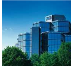
AWD Hauptsitz Headquarters of AWD