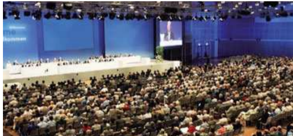
Kongressveranstaltung im HCC A convention taking place at the HCC