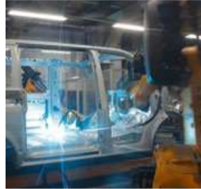
Volkswagen Nutzfahrzeuge Volkswagen Commercial Vehicles

Große Versicherer und Finanzdienstleister wie der AWD, Hannover Rück, der Talanx-Konzern, die VGH und die VHV haben hier ihre Zentralen