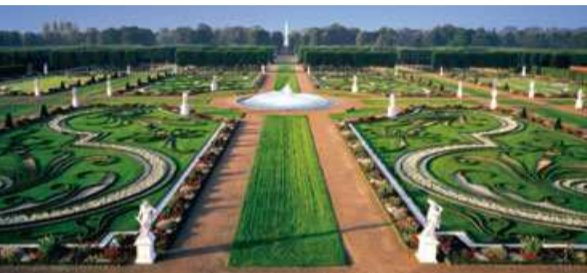
Großer Garten · Great Garden