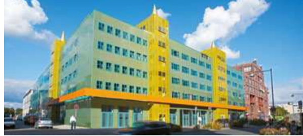
Medienzentrum Mendini-Gebäude Media centre in the Mendini Building

In addition, Hannover Airport is a popular point of departure for both business travellers and holiday makers, having a catchment area in which some ten million people live.