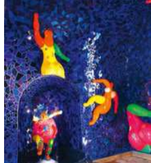
Niki-de-Saint-Phalle-Grotte Niki de Saint Phalle Grotto