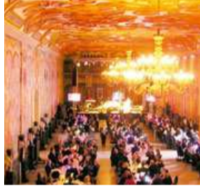
Galeriegebäude Gallery building

HannoverKongress, the congress service of Hannover Marketing and Tourism, is your central, independent point of contact for conferences, conventions and events in the Hannover Region. Under the motto "Hosted by professionals", HannoverKongress is available to answer all your questions and fulfil all your wishes relating to any aspect of business tourism. The congress service guarantees you perfect organisation, smooth-running events and a relaxed atmosphere.