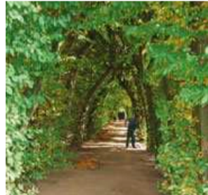
Laubengang, Neustadt am Rübenberge Arbour walk, Neustadt am Rübenberge