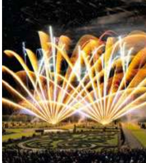
Internationaler Feuerwerkswettbewerb International Firework Competition

Just as the ladies and gentlemen of the court once used to do, today's visitors too stroll pleasurably between the richly ornamented beds, which on summer evenings are festively illuminated. Springing water babbles in hidden corners, while the Great Fountain rises to an impressive height of 70 metres. In summer the gardens become a dream backcloth for the concerts and performances of musicals and drama that make up the Herrenhausen Festival Weeks; while at the annual International Firework Competition the pyrotechnists paint fantastic pictures in the air.