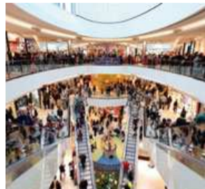
Ernst-August-Galerie Foto Photo 2