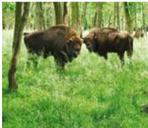
Wisentgehege Springe Bison Reserve (Wisentgehege) Springe

Im Wisentgehege Springe südlich von Hannover haben 100 Wildarten ihr Zuhause. Wölfe, Fischotter, Wisente und Braunbären zählen zur faszinierenden Vielfalt im 90 Hektar großen Tierpark. Der Tiergarten Hannover im Stadtteil Kirchrode war ursprünglich ein privates Jagdrevier von Herzog Johann Friedrich. Jetzt ist es ein beliebtes, grünes Ausflugsziel mit uralten Eichen, Kastanien und Hainbuchen. Eine 200-köpfige Dammwildherde trabt hier frei umher, Wildschweine und Wildpferde können in Gehegen besichtigt werden.