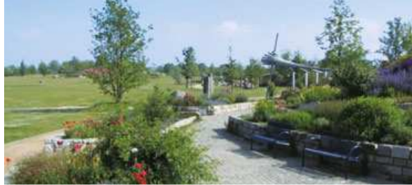
Park der Sinne, Laatzen - Park of the Senses, Laatzen

Koldingen Lakes, among the meadowlands surrounding the River Leine to the south, are exceptional and always a pleasant place to take a stroll. Water as far as the eye can see, leafy river banks and the twittering of birds in this relaxing oasis.