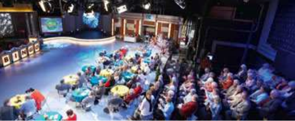
Fernsehshow Studio 3 von TVN TVN's "Studio 3" television show