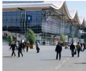
Messegelände Hannover Fair Exhibition Grounds

Die Kontakte der Deutschen Messe weltweit finden Sie unter: www.messe.de/repraesentanten