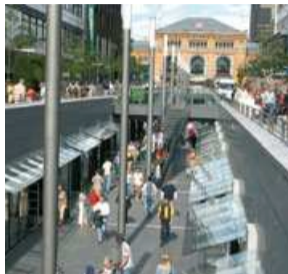
Niki-de-Saint-Phalle-Promenade Foto Photo 1

Jeden Samstag laden Niki-de-Saint-Phalles drei üppige Nanas zum Schlendern, Schauen und Feilschen in Hannovers Altstadt ein (Foto 3). Am Hohen Ufer präsentieren zahlreiche Händler auf dem traditionellen Altstadtflohmarkt ihr abwechslungsreiches Angebot.