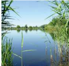
Koldinger Seen, Laatzen, Pattensen, Sarstedt Koldingen Lakes, Laatzen, Pattensen, Sarstedt