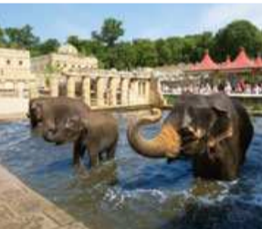
Erlebnis-Zoo Hannover Hannover Adventure Zoo

Exotische Landschaften, über 2.600 Tiere und tolle Shows im Erlebnis-Zoo Hannover: Gehen Sie auf Safari durch Afrikas Flusslandschaft Sambesi, zum imposanten Gorillaberg und in den prächtigen Dschungelpalast. Abgerundet wird das Abenteuer auf urig niedersächsische Art in Meyers Hof, wo rustikale Genüsse serviert werden.