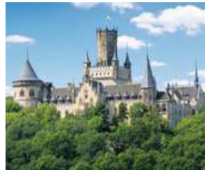
Schloss Marienburg, Pattensen Marienburg Castle, Pattensen

Hannover lies the 32 square kilometre Lake Steinhude, which caters for everything from family outings to sailing regattas. Some 20 kilometres to the south of Hannover lies the Deister. Cyclists and ramblers will find well-made and clearly marked paths, with huts, barbecue sites and plenty of opportunities to take refreshments on the way.