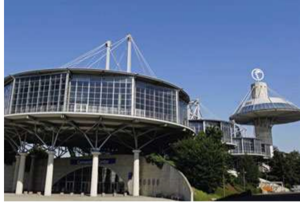
Außenansicht Convention Center Exterior of the Convention Center

The Hannover fair company Deutsche Messe, with its more than 60 representative offices abroad and eight foreign subsidiaries, plans and runs trade fairs in all the most important foreign markets. This international trade fair competence, outstanding infrastructure and excellent service can provide the ideal springboard for your business too.