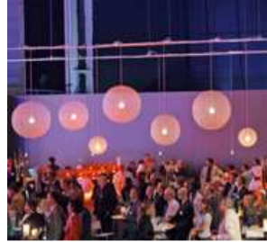
Event im Flugzeughangar Event in an aircraft hangar