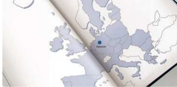
Europakarte · Map of Europe

A modern city, a state capital with groundbreaking architecture and a model infrastructure, surrounded by idyllic little towns and villages – this is Hannover with all its exciting and alluring contrasts. Some 40 different