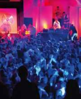
Party im Hannover Congress Centrum Party in Hannover Congress Centrum